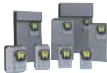
SCHNEIDER ELECTRIC (Telemecanique) Altivar, Rectivar...