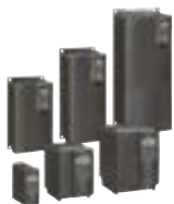
SIEMENS Micromaster, Simovert, Simoreg...