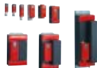
SEW Movitrac, Movidrive...