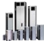
DANFOSS VLT2000, VLT3000, VLT5000, VLT6000...