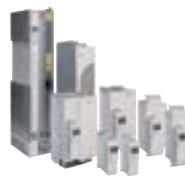
ABB ACS800, ACS 4000, ACS5000, ACS6000, DCS500B...