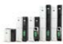
LEROY SOMER Control Techniques (CAP) Unidrive, Digidrive...