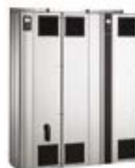
DANFOSS VLT5000, VLT6000...