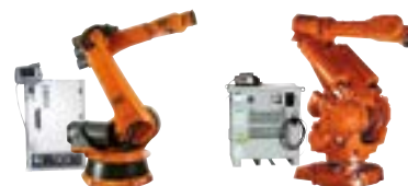
ABB : S4 > IRC5 KUKA : KRC32 > KRC4