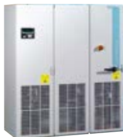
SIEMENS Masterdrive, Sinamics...