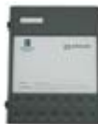
EUROTHERM 584, 590, 605, 650...